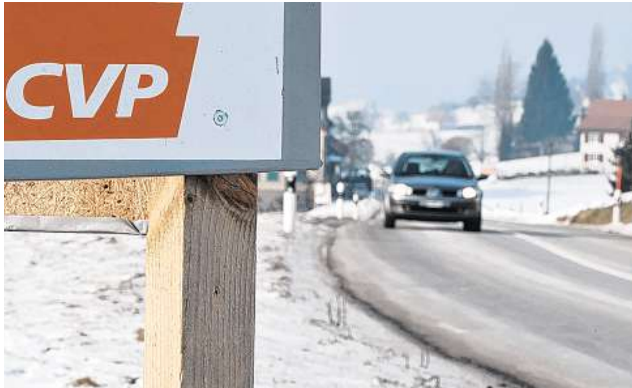
Plakate im Niemandsland: Die CVP hat ihre Wahlwerbung vor allen anderen Parteien aufgestellt.

Die Omniprésenz der CVP ist den anderen Parteien nicht entgangen. «Sie haben ihre Kampagne sehr früh